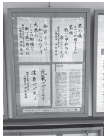
(平和祈念館での展示状況)

が、岡山平和祈念館にこの書を寄贈していただき、展示しておりますので、ご来館の際にはぜひご覧いただければと思います。