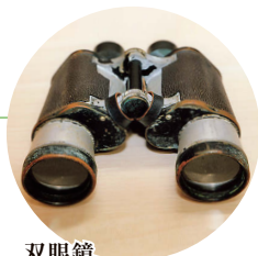
双眼鏡 (玉野市 藤原又三郎氏提供)