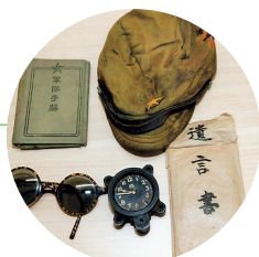
遺言書・遺品等