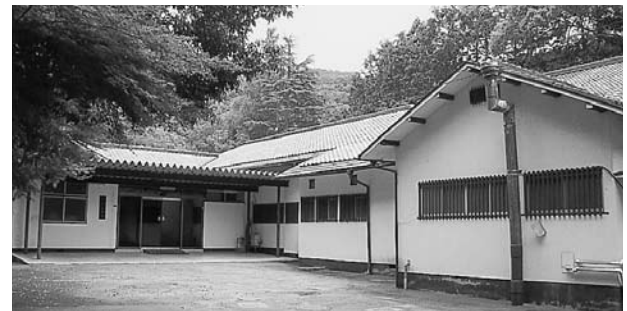
現在の「いさお会館」